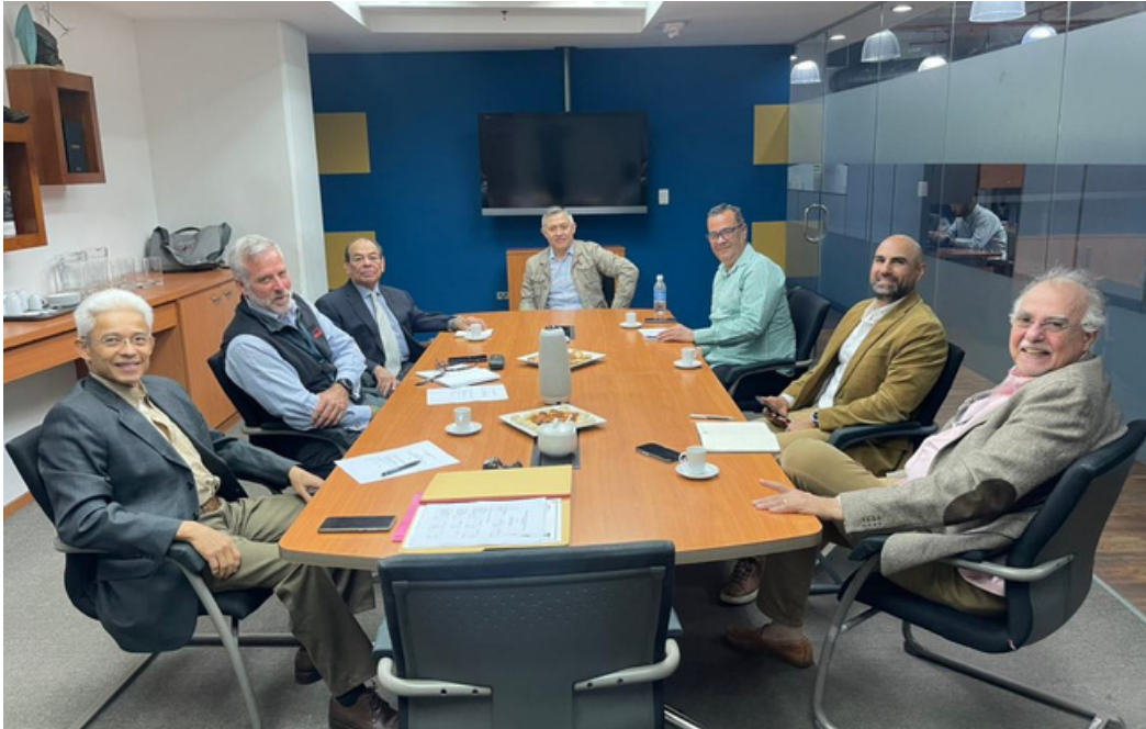
En la gráfica, momento de la reunión de la Junta Directiva, en las oficinas de C.A. Ron Santa Teresa, el 29 de febrero de 2024.