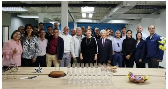
Asistentes al Directorio Ampliado de CAVEDATOS.